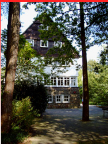
Jugendbildungsstätte Köttingen des CVJM Kreisverbandes Köln